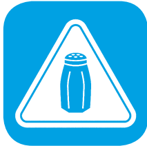
مصرف زیاد نمک

عوامل زمینه‌سازی وجود دارند که می‌توانند به افزایش احتمال بروز فشار خون بالا در افراد منجر شوند. به این عوامل، عوامل خطر فشار خون گفته می‌شود. مهم‌ترین عوامل خطر بیماری فشار خون بالا عبارتند از: