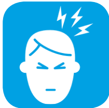
استرس و فشار عصبی