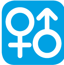
سن و جنسیت