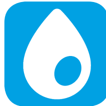
میزان چربی خون